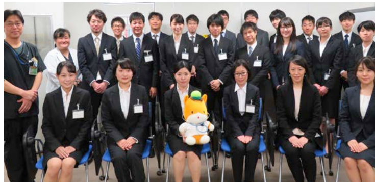
今年の新研修医です！

これからもスタッフ一同協力しながら、本院で研修される方々が快適に充実した時間を過ごせるよう、また、さらに多くの方々に研修先として選んでもらえるように努めてまいります。よろしくお願いいたします。