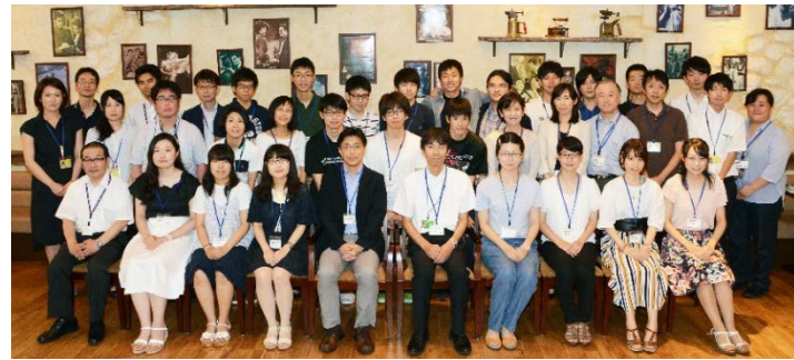
医学生との情報交換会を開催しています

男女問わず、充実したキャリアを目指す医療者を支援するため、2016年、女性医師等教育・支援部門から名称変更しました。個々のニーズに合わせた再教育プログラムである医師ワークライフ支援プログラムを活用し、無理のない職場復帰を支援します。