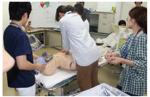
スキルラボ、実習中です！

スキルラボ部門は、スキルラボセンターの管理・運営および独自のセミナーの企画・開催を行っています。利用者の方々のお役に立てるよう、また気持ちよく利用していただけるよう、日々努力して参ります。ご協力よろしくお願いたします。