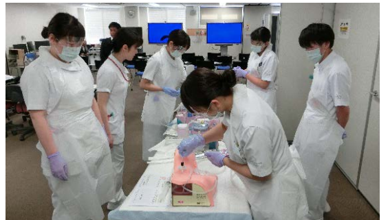
看護職員研修中です！

看護職キャリア支援部門では、研修企画・運営および保健学研究科との連携推進、また地域看護職の研修支援や看護学生の臨地実習支援等を行い、看護職の実践能力向上を支援しています。