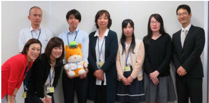
縁の下の力持ちとして頑張ります！