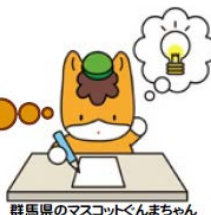
群馬県のマスコットくんちゃん

この秋、注目☆の シリーズ第2回! 第1回 に参加できなかった方 にも来てほしい♡