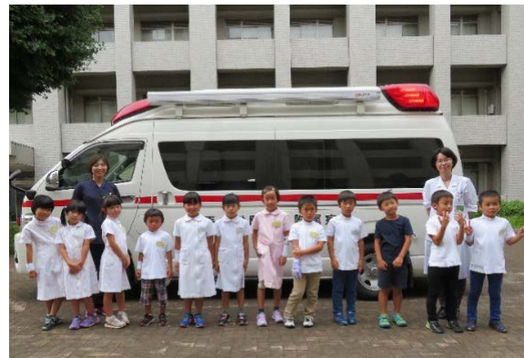
白衣姿がとても似合っていますね