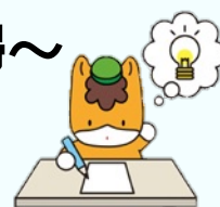
群馬県のマスコット ぐんまちゃん